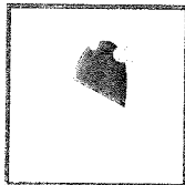
キャップ シリコンキャップ、 メッシュキャップ