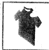
衣類 Tシャツ、 インナー(アンダーシャツ)、 ジャージ、ビステ、 トレーニングウェア、パーカーなど